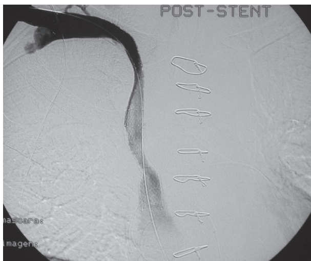
Fig. 2. Recanalización de la vena cava superior y del eje braquiocefálico derecho con implante de tres stents autoexpandibles. Resultado final.

La incidencia comunicada de esta complicación es del 1,3% en pacientes sometidos a trasplante cardíaco. (6) Se ha citado (6, 7, 9) como factor causal más importante en el desarrollo de esta complicación la desproporción de los diámetros entre la vena cava donante y la receptora.